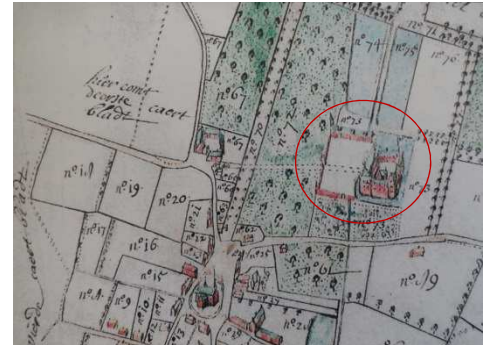
Het hof te Meise ○ Gelegen aan het kasteel van Meise Kaart a° 1717