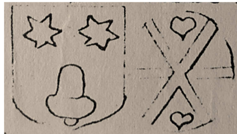
van Waerbeek de Prince