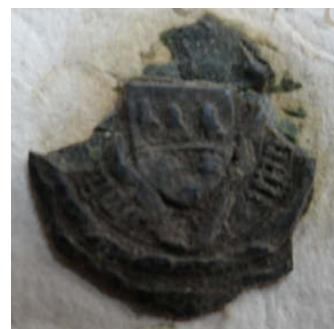
Zegel van Opstalle