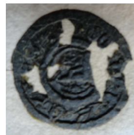
Zegel Wouter Aerts geheeten van Gestele leendenombrement 14 mei 1440 familiearchief de Merode VM 454