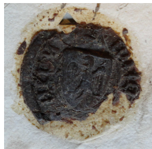
Zegel Anthoon Aerts geheeten van Gestele leendenombremment 11 augustus 1468 familiearchief de Merode VM 454