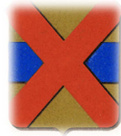
Geraerd II van Grimbergen