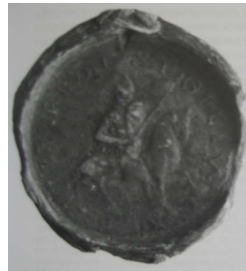
Zegel Wouter I Bertout SIGILLVM GALTERI BERTALDI

III. Wouter I Berthout † 1180. heer van Grimbergen (1178, 1180) Reisde vermoedelijk in 1157 naar Palestina 1 . x Margareta van Grimbergen: van wie: