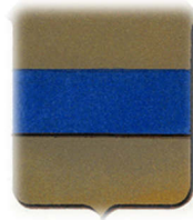
Arnold II van Grimbergen

II. Geraerd I van Grimbergen † 1131. x Oda van Aarschot (cit 1125). van wie: