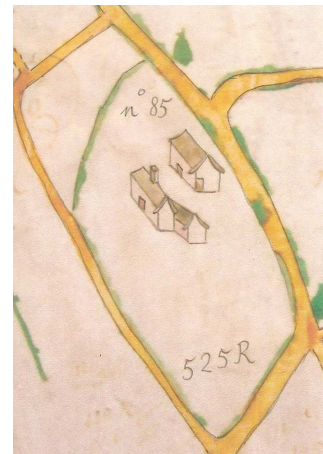
Het hof ter Elst a° 1725 (kaartboek gemeentehuis Wemmel)