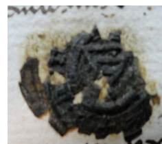
Zegel Aert Buelen a° 1467 Familiearchief de Merode- Westerlo VM454 Leenenombrement 13 juli 1467