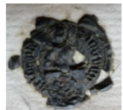
Zegel Jan van den Gersmoirtere geheeten Schotte Familiearchief de Merode VM 454 Leendenombrement 13 augustus 1467