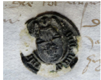
Zegel Geert van den Gersmoirtere geheeten Schotte Familiearchief de Merode VM 462 Leendenombrement 15 juli 1467