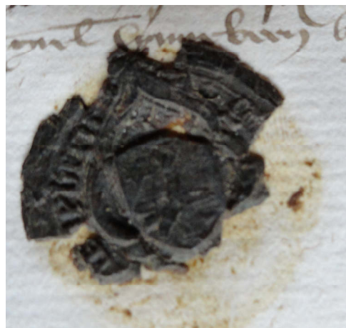
Zegel Gielys Hinnebeen Familiearchief de Merode-Westerloo, VM454, leendonbrement 16 augustus 1468