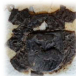
Zegel Daneel Lemmens geheeten van Leest a° 1467 (familiearchief de Merode VM 454 leendenombrementen vanaf 1440)