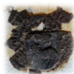
Zegel Daneel Lemmens geheeten van Leest a° 1467 (familiearchief de Merode VM 454 leendenombrementen vanaf 1440)