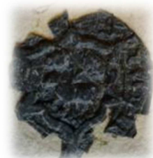
Zegel Laureys van Leest a° 1440

(familiearchief de Merode VM 454 leendenombrementen vanaf 1440)