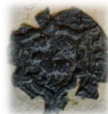
Zegel Laureys van Leest a° 1440

(familiearchief de Merode VM 454 leendenombrementen vanaf 1440)