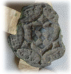
Zegel van Hendrik van den Obbergen, leenman van 'onser gheminder Vrouwe van Grymberghē' (Maria van Vianden) *S heinrici de obberge charter 14 maart 1366 familiearchief de Merode LA 114

KBR, Houwaertfonds, II. 6499, folio 131 nr 2