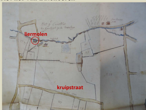
Het hof van Batenborch