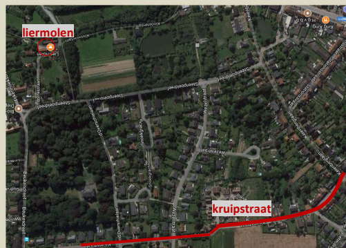
Verdwenen 'geleeghe' [kasteel] waarvan de ligging, op basis van de info uit de registers, kan gesitueerd worden tussen de kloosterdam en de Kruipstraat

De leenboeken der heren van Grimbergen (waarin de opeenvolgende eigenaars geregistreerd werden), en gegevens uit de schepenbank van Grimbergen en Vilvoorde maakten het mogelijk deze genealogie verder uit te werken.