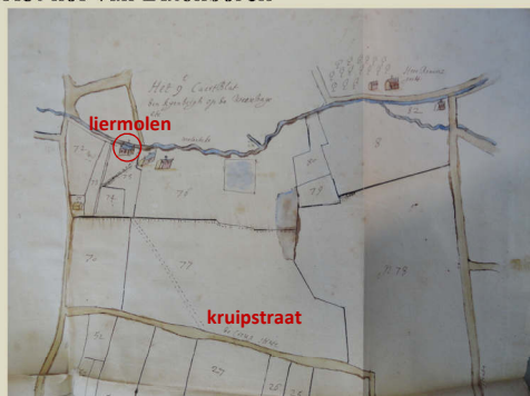
Het hof van Batenborch