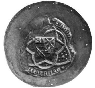
Zegel Oda van der Thommen 21 dec 1374 – AR Brussel zegelafgietsel 22231