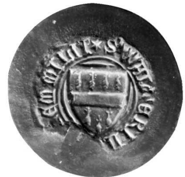
Zegel Wouter van Laethem 30 jun 1372 – AR Brussel zegelafgietsel 25414