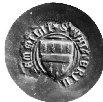
Zegel Wouter van Laethem 30 jun 1372 – AR Brussel zegelafgietsel 25414