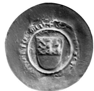
Zegel Goswin van der Thommen 17 mei 1355 – AR Brussel zegelafgietsel 27842