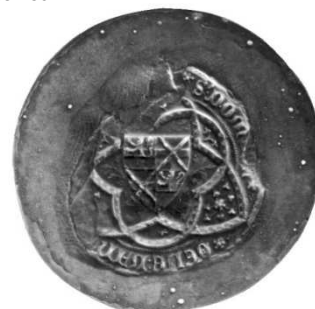
Zegel Oda van der Thommen 21 dec 1374 – AR Brussel zegelafgietsel 22231